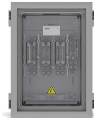
ENC-160 / DIN (17531)