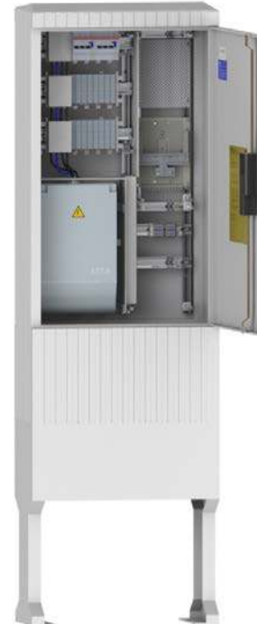
KVS-190/58 160A, Hybrid + LS